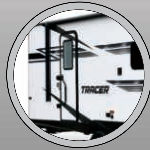
CHARNIÈRES DE PORTE À FRICTION