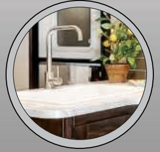
COMPTOIRS SANS JOINT DE STYLE RÉSIDENTIEL