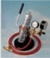
Test de pression 'Seek-A-Leak'

Ceci a pu être accompli en nous dévouant à respecter des 'Normes Supérieures' dans la conception, la construction, les tests et le service à la clientèle. Voyez par vous-mêmes – nous sommes certains que vous serez impressionnés!