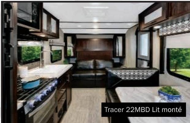
Tracer 22MBD Lit monté