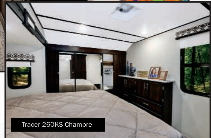
Tracer 260KS Chambre

Nos unités Tracer Ultra Lite offre de spacieux espaces, des ameublements résidentiels de luxe et d'autres caractéristiques que vous ne trouverez généralement pas dans une caravane ultralégère qui est souvent plus légère de quelques milliers de livres que des caravanes traditionnelles!