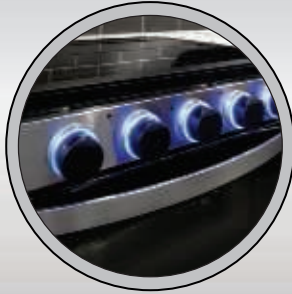
CUISINIÈRE AVEC COUVERT EN VERRE ET LUMIÈRE DEL