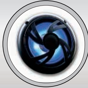
HAUT-PARLEURS EXTÉRIEURS AVEC LUMIÈRES DEL BLEUES