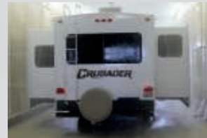
Tunnel de pluie