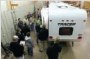
Audits de qualité par les dirigeants