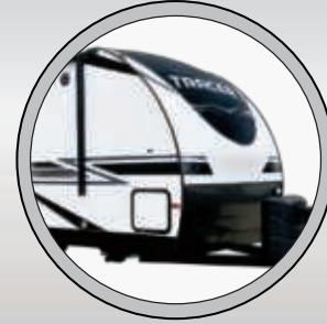
CAP AVANT AÉRODYNAMIQUE AVEC PLAQUE DE PROTECTION LARMÉE