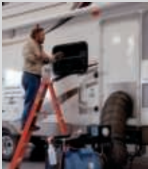
Test des joints à l'air sous pression