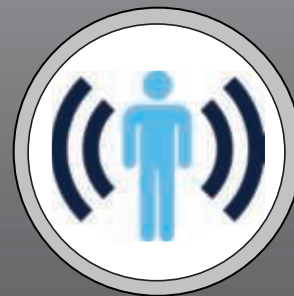
LUMIÈRES AVEC DÉTECTEUR DE MOUVEMENT