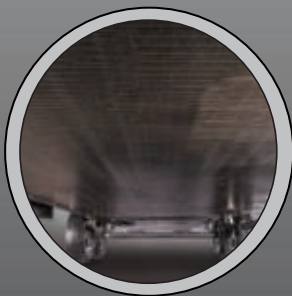
DESSOUS D'UNITÉ FERMÉ ET CHAUFFÉ