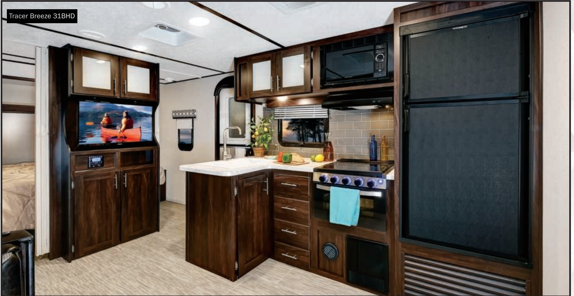
Tracer Breeze 31BHD