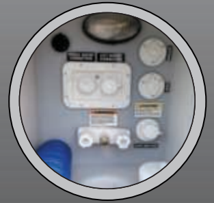
CENTRE DE RACCORD UNIVERSSEL (N/D BREEZE)