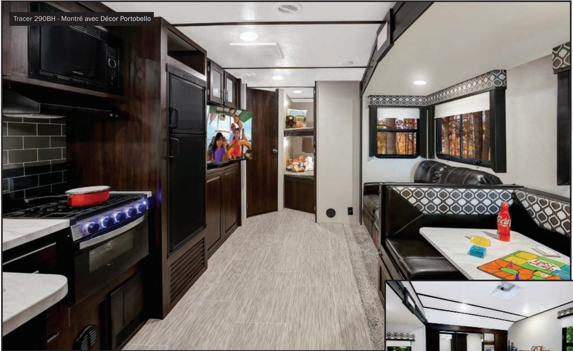
Tracer 290BH - Montré avec Décor Portobello

Pour un client qui recherche une caravane de voyage ultralégère sans sacrifier le style, le confort, ou la commodité... nous avons conçu notre série de caravanes de voyage Tracer.