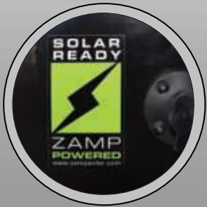
PRÉPARÉ POUR ÉNERGIE SOLAIRE