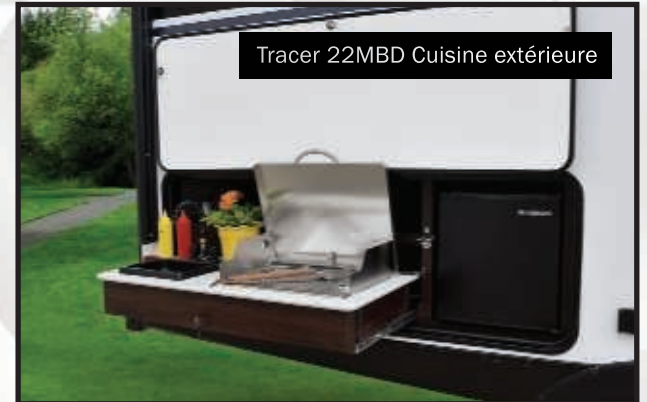
Tracer 22MBD Cuisine extérieure