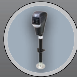
TIMON ÉLECTRIQUE (N/D BREEZE)