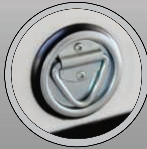
ANNEAU POUR ACCROCHER LA LAISSE DU CHIEN