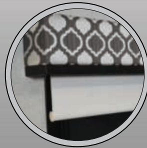
STORES À ROULEAU