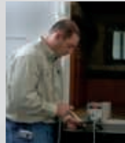
Inspection pré-livraison secondaire en 65 points