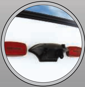
PRÉPARÉ POUR CAMÉRA DE REcul