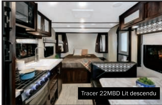
Tracer 22MBD Lit descendu