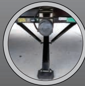
STABILISATEURS ÉLECTRIQUES (N/D BREEZE)